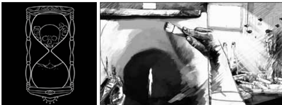
animação da ampulheta do loading · estética e animação dos vários flashbacks de Frank

Disponível em: https://store.steampowered.com/app/1530800/Frank_and_Drake/