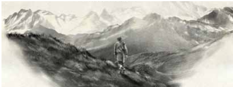
Ilustração e animação de quatro histórias tradicionais portuguesas. “Contos Tradicionais Portugueses” trata-se de uma aplicação em fase de produção, contendo contos interactivos destinados a crianças entre os 6 e os 10 anos.