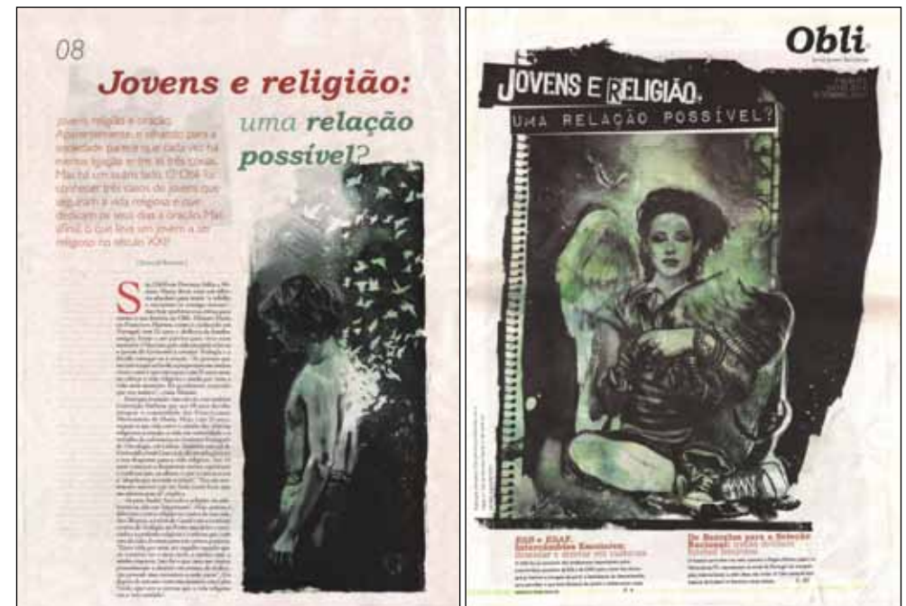
Ilustração para capa e artigo da quinta edição de Obli - Jornal Jovem Barcelense.