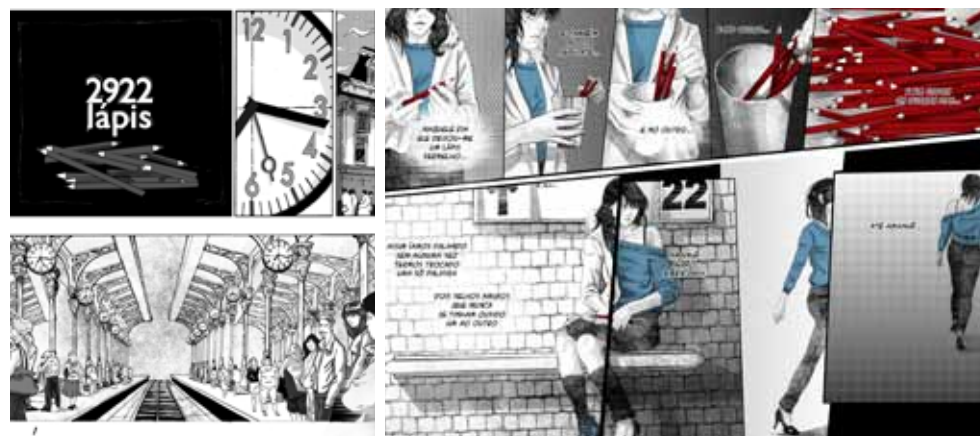
Ilustração de um pequeno conto em formato de banda desenhada.