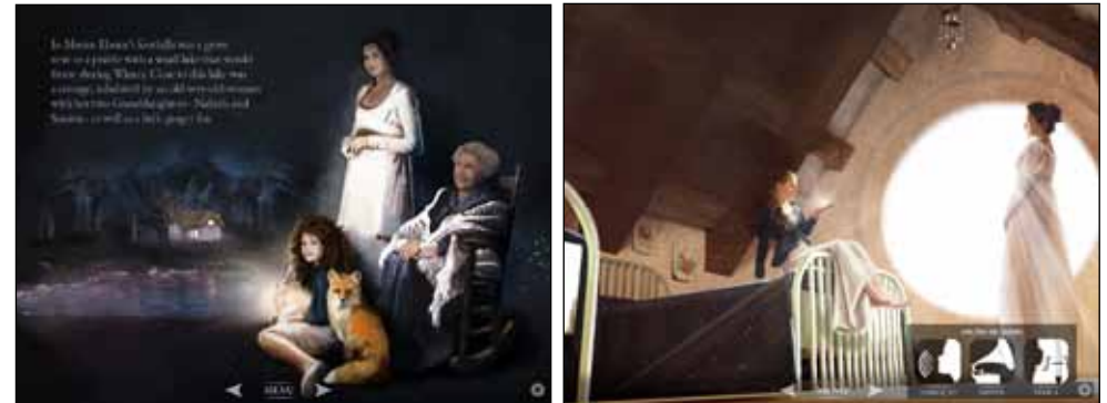
Ilustração e animação de um livro interactivo destinado a crianças entre os 6 e os 12 anos de idade. Por razões de descontinuidade de versões antigas para sistemas operativos mais recentes, “A Velha que Colhia Estrelas” já não se encontra à venda na App Store.